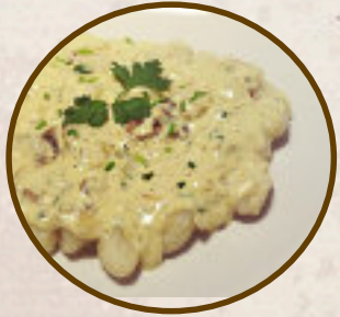
Domaći njoki u umaku od gljiva Homemade gnocchi in mushroom sauce