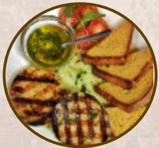
Marinirani grill sir Marinated grilled cheese