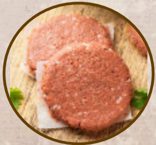
Vege odrezak (od proteina graška) +povrće Veggie steak+vegetables